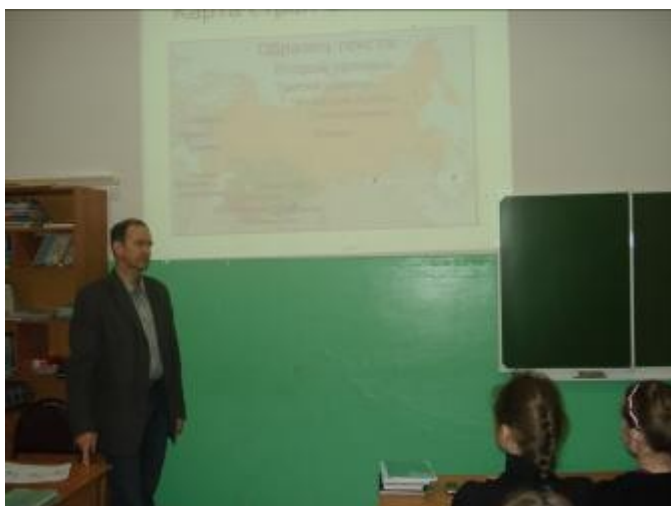
Презентация «СНГ: 20 лет истории»